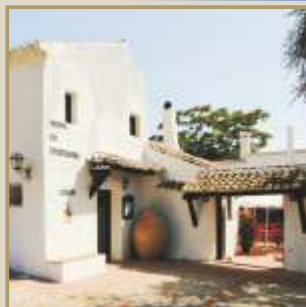
Venta de Alfarnate

ALFARNATE, EL PUEBLO MÁS ALTO DE MÁLAGA. NATURALEZA, PRODUCTOS LOCALES, TRADICIÓN Y SABOR DE LA SIERRA