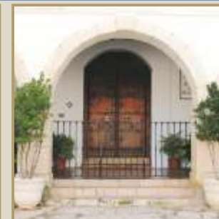
Santuario de la Virgen de Monsalud