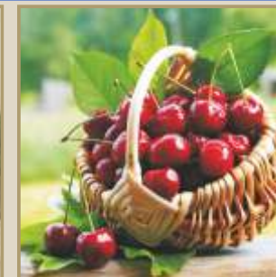
Alfarnate Capital de la Cereza

Alfarnate, pueblo serrano, enclavado en un paraje natural en el extremo noroccidental de la Axarquía malagueña , rodeado por las sierras de Enmedio, Palomera y Jobo. Estas montañas rocosas contrastan con los cultivos de olivos, cereal y cerezos del valle.