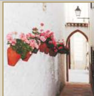
Calle típica de Alfarnate