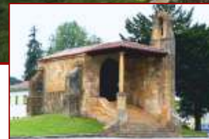
Iglesia y Dolmen de la Santa Cruz