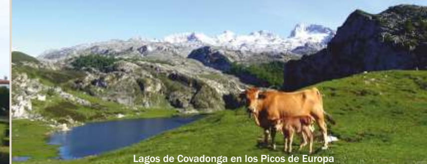
Lagos de Covadonga en los Picos de Europa