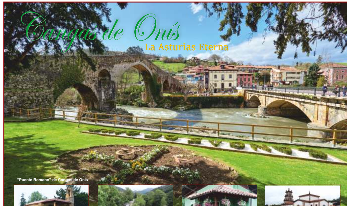
“Puente Romano” de Cangas de Onís