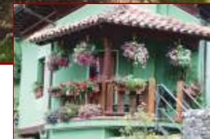
Casa rural en primavera