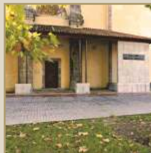
Aula del Reino de Asturias