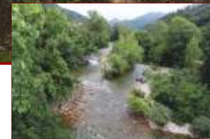
Río Sella en Cangas de Onís