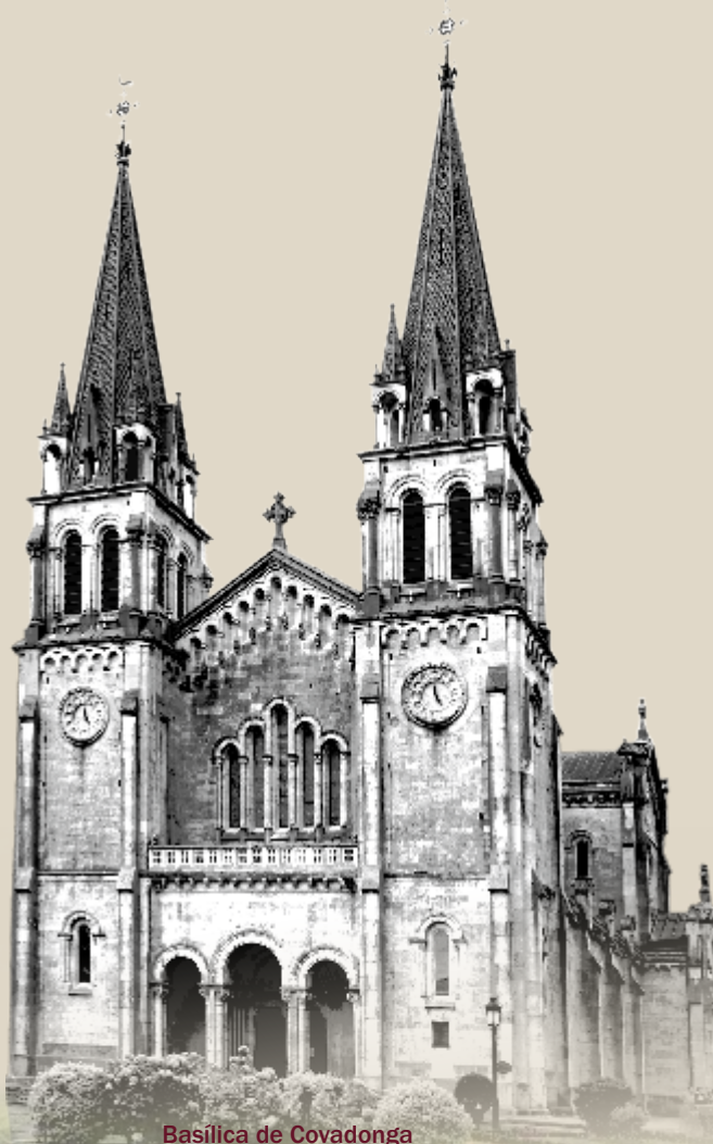
Basilica de Covadonga

¡Cangas de Onís Te espera!, ¡Tendrás que venir!.