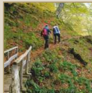
Senderismo en Cangas de Onís