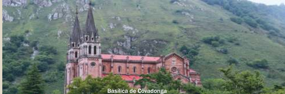
Basilica de Covadonga