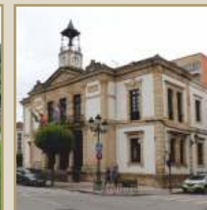
Ayuntamiento de Cangas de Onís