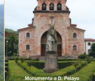
Monumento a D. Pelayo