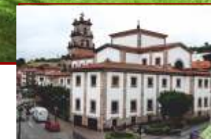
Iglesia de Ntra. Sra. de la Asunción