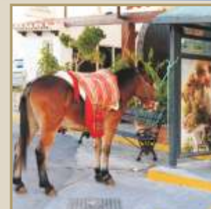
Estampa costumbrista en Canillas