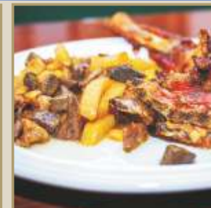
Gastronomía tradicional: Chivo de Canillas