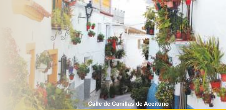
Calle de Canillas de Aceituno