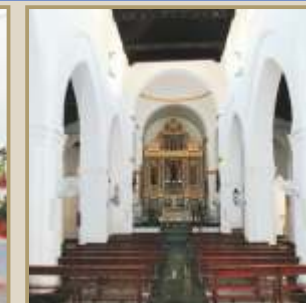
Nave central Iglesia Ntra. Sra. del Rosario