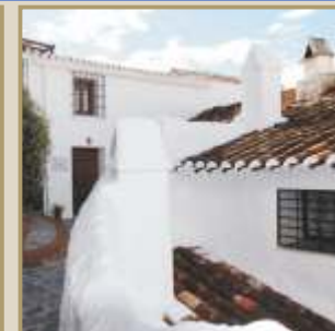
Arquitectura típica de Canillas