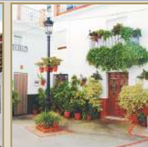
Plazuela de cal y flores