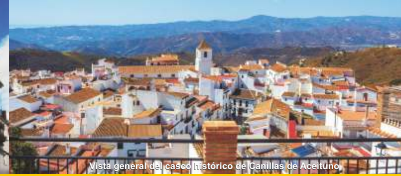
Vista general del casco histórico de Canillas de Aceituno