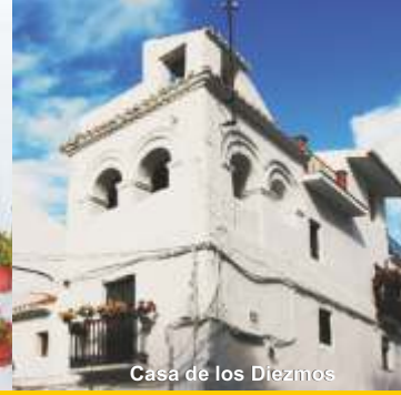
Casa de los Diezmos