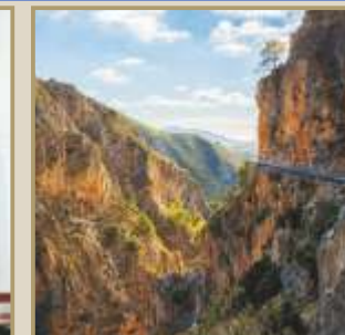
Sendero de "El Saltillo"

El nombre de Canillas de Aceituno tiene sus raíces etimológicas en el vocablo latino Cannillae (zona de cañaverales) y del vocablo árabe Azeytuni (seda tejida y teñida) siendo la producción y el comercio de la seda la actividad más productiva que los musulmanes desarrollaron en la zona. Las primeras noticias que tenemos de su historia corresponden a la época de la presencia árabe, en la que, con toda probabilidad, se creó el primitivo núcleo de población. La etapa andalusí significa una población de cultura árabe entre los siglos VIII y XV, se aprovecharon arroyos y se estableció un minifundismo de bancales adaptados a las pendientes donde se cultivaban hortalizas y árboles frutales..