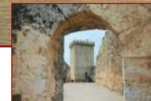
Castillo de Peñaranda de Duero