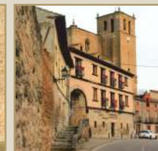
Torre de la Ex-Colegiata de Santa Ana