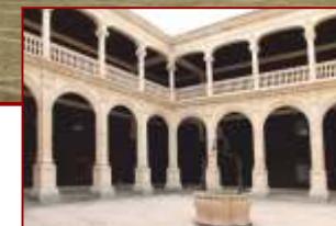
Palacio de Avellaneda