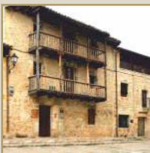
Oficina de Turismo