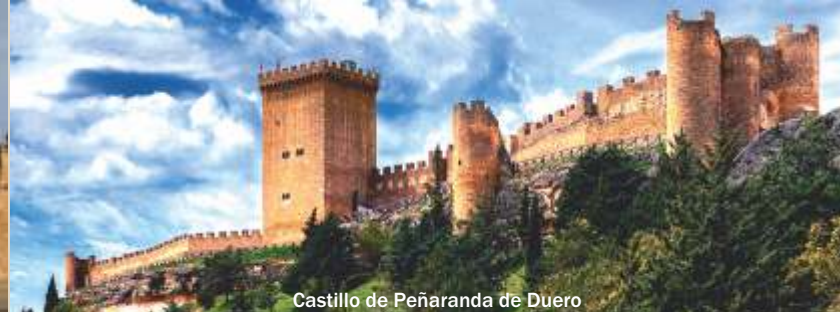
Castillo de Peñaranda de Duero