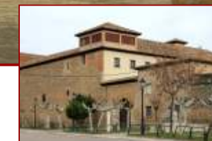
Monasterio Madres Franciscanas (Concepcionistas)

Peñaranda de Duero se halla emplazada en la margen derecha del río Arandilla, afluente del Duero, punto de contacto entre la fértil vega del Duero y las primeras estribaciones de la Demanda. Etimológicamente, su nombre significa ciudad de la peña y el río, lo cual alude a su emplazamiento de carácter estratégico en lo alto de un cerro. En efecto, probablemente Peñaranda y Aranda fueran repoblados de forma simultánea a comienzos del siglo X, cuando la frontera cristiana llegó hasta el Duero. De cualquier forma, aparece por primera vez mencionada en torno al año 1000 por su condición de plaza fuerte defensiva. En un principio formó parte del alfoz de Clunia. Más tarde pasó a formar parte de la Comunidad de Villa y Tierra de San Esteban en la primera división de provincias de Javier de Burgos pasó a formar parte de Segovia y actualmente pertenece a Burgos.