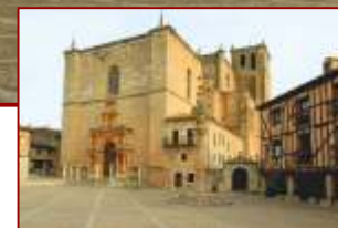
Ex-Colegiata de Santa Ana