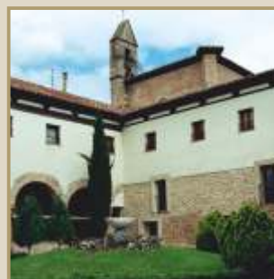
Patio del Monasterio MM. Concepcionistas