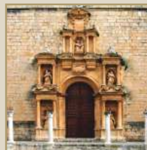
Portada Ex-Colegiata de Santa Ana