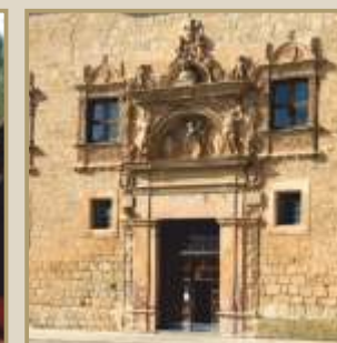
Fachada Palacio de Avellaneda