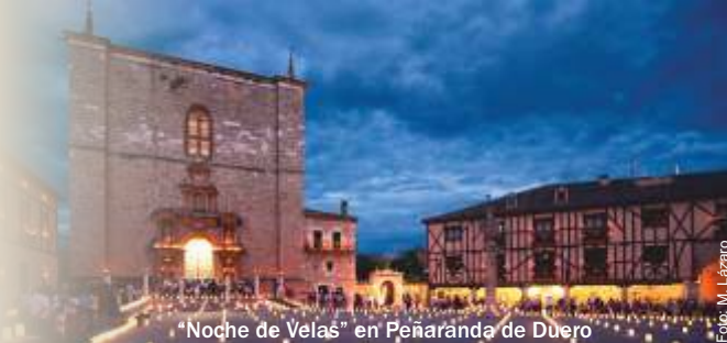
"Noche de Velas" en Peñaranda de Duero

La Villa de Peñaranda de Duero está declarada Conjunto Histórico Artístico y fue reconocida en 2018 como el "Pueblo más bello de Castilla y León".