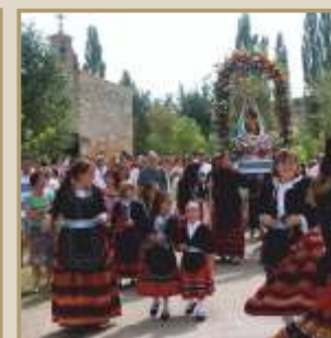
Procesión de la Virgen del Rosario