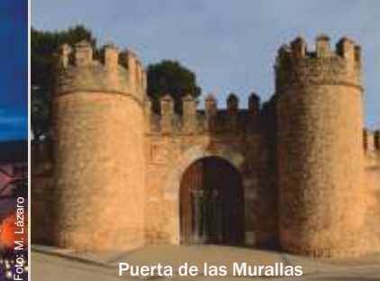
Puerta de las Murallas