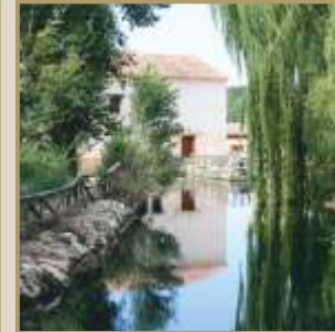
Molino de los Ojos