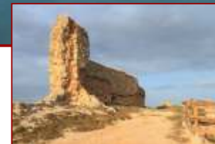
Castillo de San Esteban de Gormaz