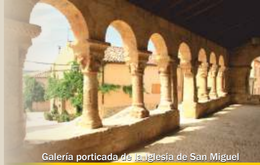
Galería porticada de la Iglesia de San Miguel