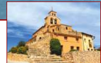
Iglesia románica de Santa María del Rivero