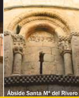
Ábside Santa Mª del Rivero