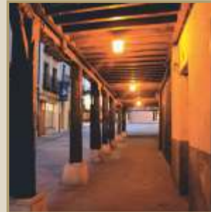
Calle Mayor de San Esteban de Gormaz