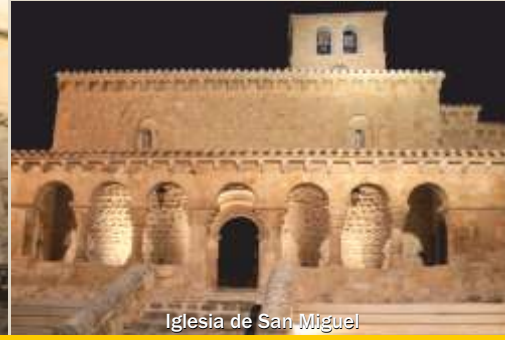
Iglesia de San Miguel