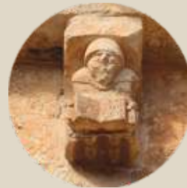
Canecillo fundacional de la Iglesia de San Miguel

En el Cantar de mío Cid , San Esteban de Gormaz es citada reiteradamente; esto y el conocimiento de la toponimia de los alrededores, ha llevado a pensar a algunos estudiosos que el poeta anónimo pudiera haber vivido o ser oriundo de esta localidad. Lo cierto es que San Esteban y sus alrededores juegan un papel muy importante en el poema. Es precisamente en esta población, de la que el Cantar dice: “ los de Sant Estevan siempre mesurados son ”, donde las hijas del Cid son cuidadas tras la afrenta sufrida en el robleal de Corpes por los infantes de Carrión.