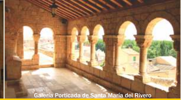
Galería Porticada de Santa María del Rivero