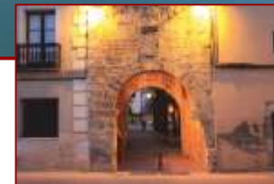
Arco de la Villa