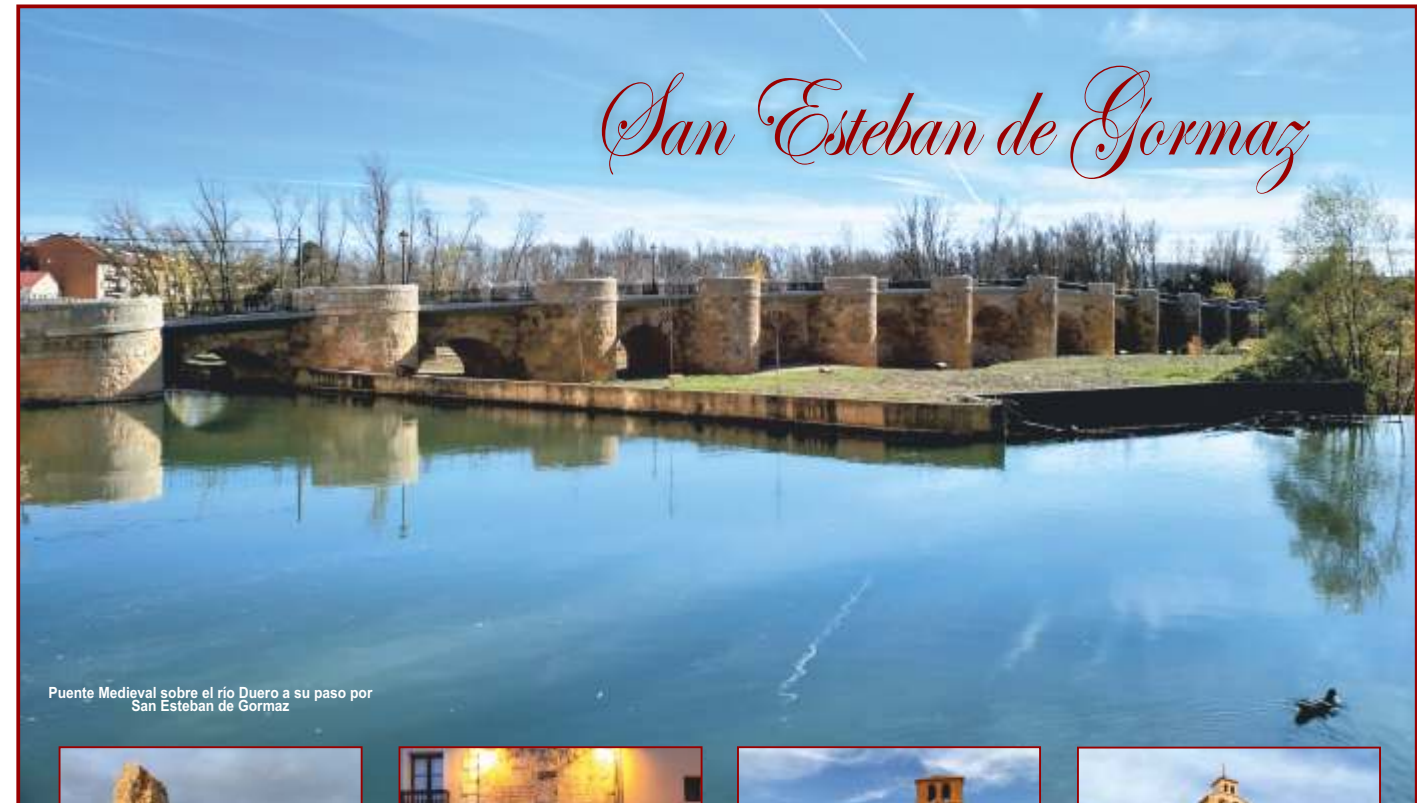
Puente Medieval sobre el río Duero a su paso por San Esteban de Gormaz