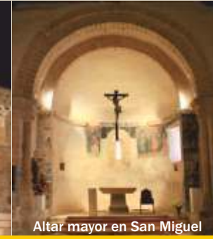
Altar mayor en San Miguel