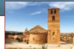
Iglesia románica de San Miguel