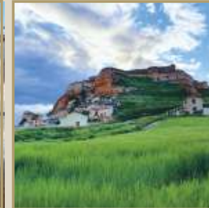
Vista parcial de San Esteban de Gormaz