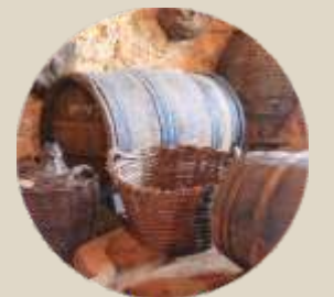
Útiles de viticultura en el Lagar Comunitario de San Esteban de Gormaz