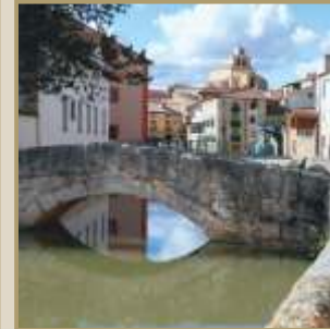
Puente medieval y paisaje urbano