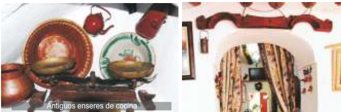
Antiguos enseres de cocina