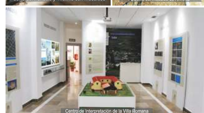
Centro de Interpretación de la Villa Romana

Las dependencias excavadas se identifican con una pequeña parte de lo que sería la Villa en su conjunto. Las intervenciones arqueológicas han dejado al descubierto parte del peristilo de la villa, coronado por un triclinio, que cuenta con un original ninfeo en la cabecera, conectado con un estanque en "U" que rodea buena parte del triclinio. En el peristilo se ha documentado un canal perimetral, que recogía el agua de la lluvia y parte de un pequeño pabellón cubierto, situado delante del triclinio. Al noroeste y sureste del pasillo del peristilo, la villa desarrolla dos habitaciones ubicándose las termas en una de ellas. El Centro de Interpretación de la Villa Romana, situado en el Ayuntamiento de Salar, nos explica la importancia del yacimiento y guarda algunos de los restos arqueológicos encontrados.