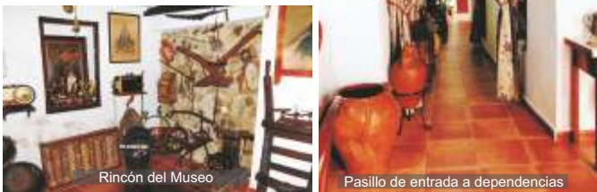
Rincón del Museo