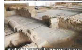
Pasillo del Peristilo y Triclinio con mosaicos