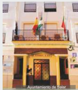
Ayuntamiento de Salar