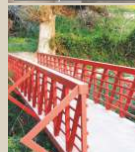
Puente sobre el Arroyo de Salar en el Parque Carolina Trassierra Nieto

Revueita de Enciso. Los restos localizados, en diversas torres vigías, y distribuidos en los parajes del Bañuelo, Los Tajos, La Fuente Alta, Los Llanos, Cortijo de los Pozos y la Torre de Salar, construida en el siglo XIII y reformada en varias etapas, son la huella musulmana en el municipio. El 29 de mayo de 1486, Hernán Pérez del Pulgar y Osorio toma la torre y recinto amurallado de Salar. Por concesión Real fundó el mayorazgo de Salar, iniciándose así la presencia cristiana hasta nuestros días.