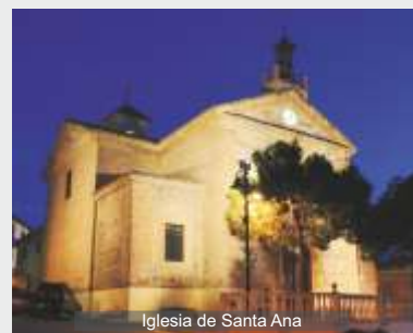
Iglesia de Santa Ana