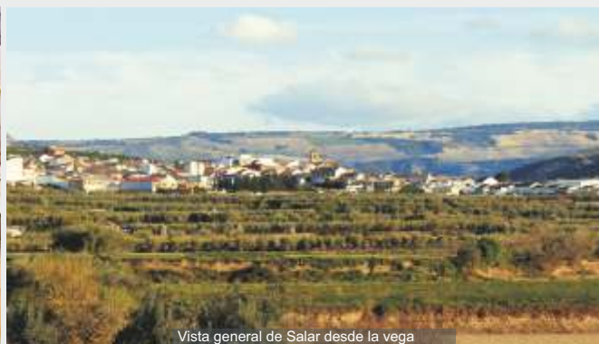
Vista general de Salar desde la vega