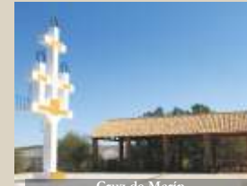
Cruz de Marín