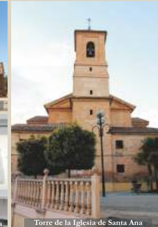
Torre de la Iglesia de Santa Ana