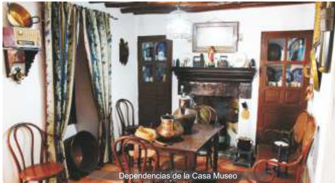
Dependencias de la Casa Museo

Ubicado en una antigua casa, en pleno casco urbano, con siglos de historia, se dispone en función de las necesidades de ese modo de vida sencillo y lleno de trabajo y esfuerzo. Parte de la vida de la casa se disponía en torno a la chimenea, el hogar donde se hacía la comida, donde se calentaba la familia en invierno, donde se contaban historias cuando la luz del día daba paso a la noche.