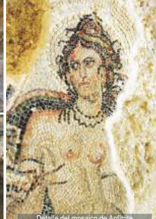
Detalle del mosaico de Anfítrite