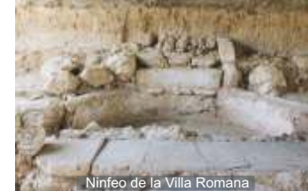
Ninfeo de la Villa Romana

La Villa Romana se localiza en el término municipal de Salar, situado en la parte meridional de la comarca de Loja, en la provincia de Granada. Los restos arqueológicos los localizamos exactamente en la vertiente izquierda de la cuenca del Arroyo de Salar, en plena Vega e inmediato a la carretera local A- 4155 que parte del enlace de la A-92 y llega hasta la localidad, concretamente en el paraje conocido como la Revuelta de Enciso. Los trabajos arqueológicos comenzaron en 2006 culminándose en el mes de octubre del año 2011. El proyecto de excavación y puesta en valor de la Villa de Salar continúa a día de hoy, esperando poder continuar con los trabajos y que éstos den a conocer la verdadera entidad del yacimiento y confirmen la importancia que tuvo esta zona de la provincia Bética y la Villa de Salar en el período alto-imperial, durante los siglos I al III d.c.